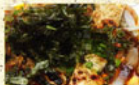
・韓国辛みそ豆腐