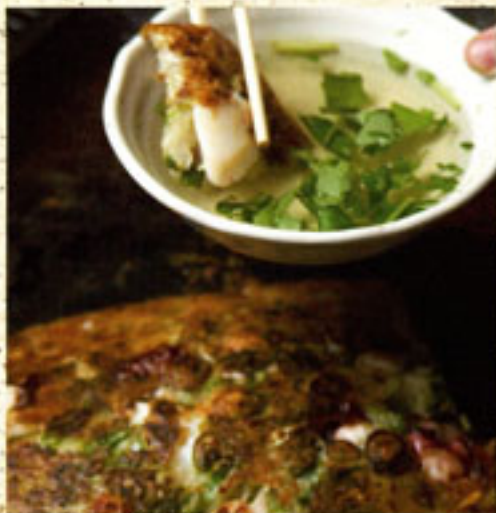
・神戸だしお好み焼き