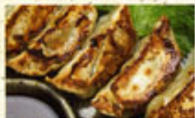
・南京町ギョーザ