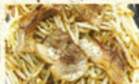
・太もやし豚炒め