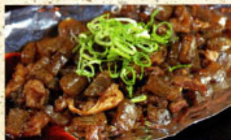
・神戸長田の味 ぼっかけ (牛すじ肉とごんにやくを込み)