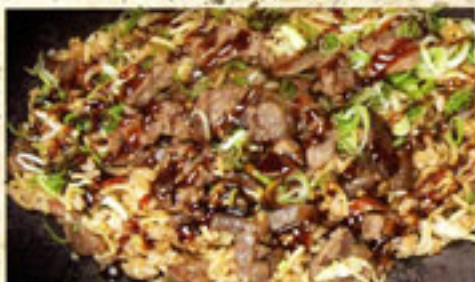
・神戸名物 そばめし