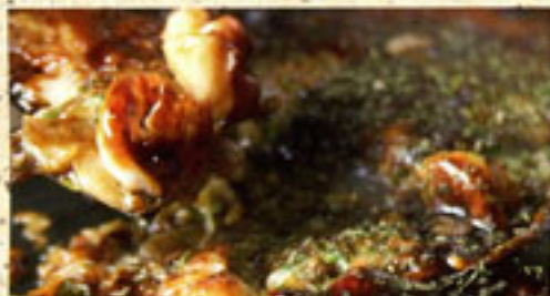
・薄焼きお好み焼き